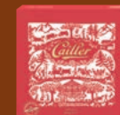
Ambassador Swiss Art 231g