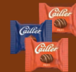
Boîte L 300g de petits pralinés