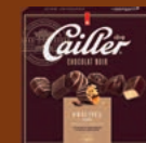
Chocolat Noir 207g