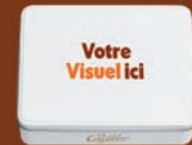
Boîte L 193x135x52 mm