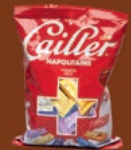
Boîte L 250g de Napolitains